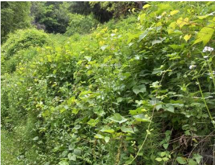
FOTO 4 - Cespugliosa