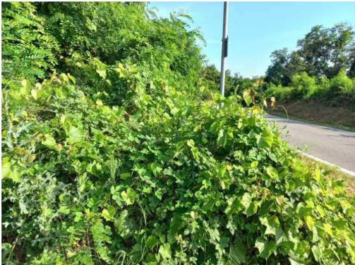
PORTAMENTO CESPUGLIOSO DI VITE INSELVATICHITA, A RIDOSSO STRADA, CHE TENDE A INVADERE SEGNALETICA STRADALE