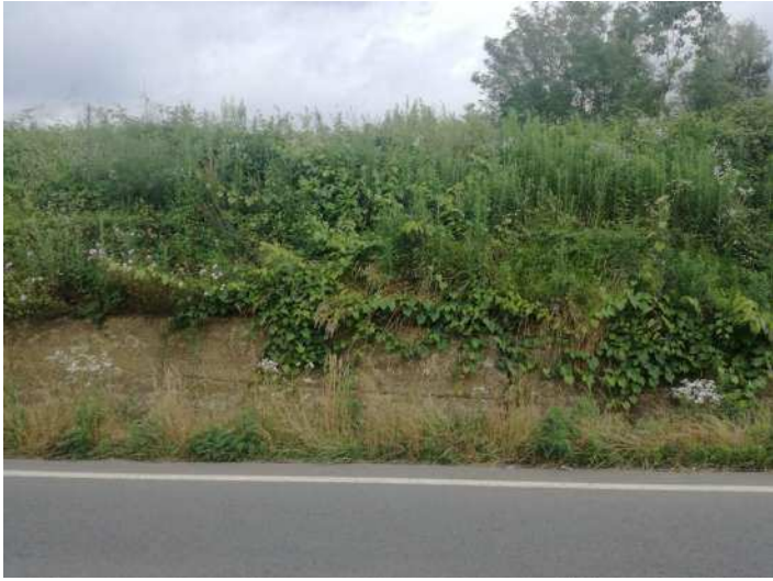
PORTAMENTO VITE INSELVATICHITA SU MURO