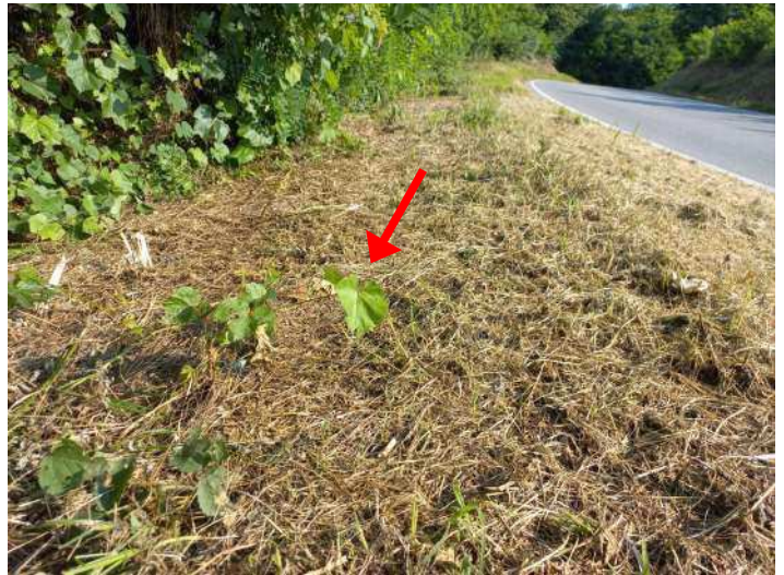
RICACCI DI VITE INSELVATICHITA

Partenza: AOO A1700A, N. Prot. 00008135 del 16/04/2026