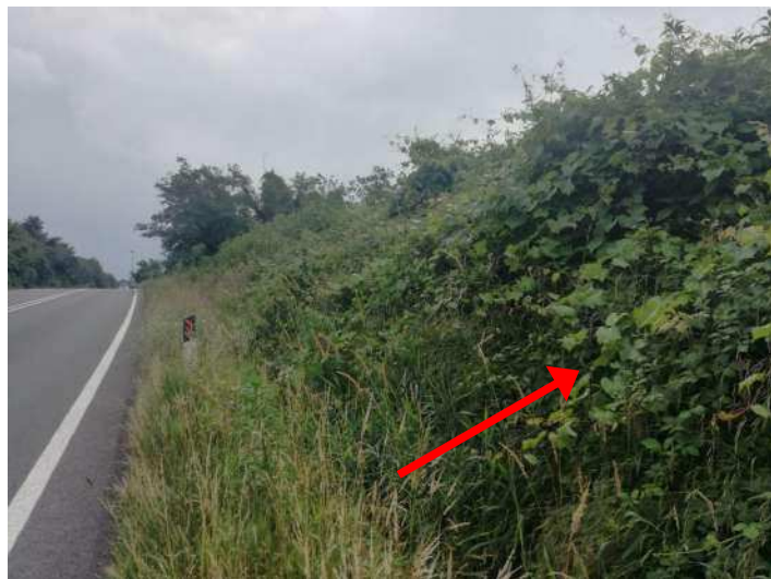
LA FOTO MOSTRA VITE INSELVATICHTA CRESCIUTA SU ROVI