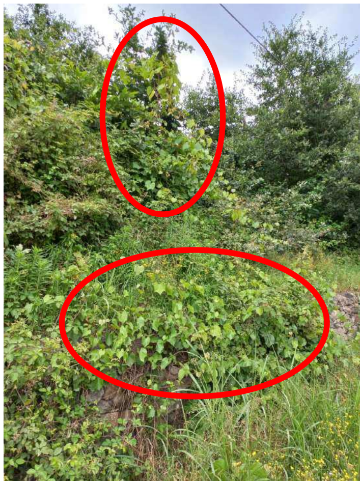
ESEMPI DI VITE INSELVATICHTA RICOPRENTE LA VEGETAZIONE ERBACEA E ARBOREA; LE FOTO NE EVIDENZIANO IL CARATTERISTICO PORTAMENTO