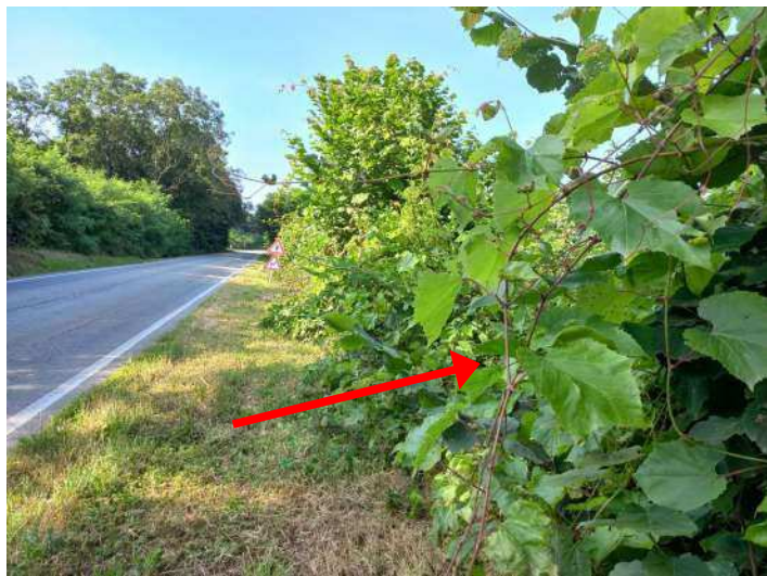
PARTICOLARE DI FOGLIE VITE UTILE AL RICONOSCIMENTO