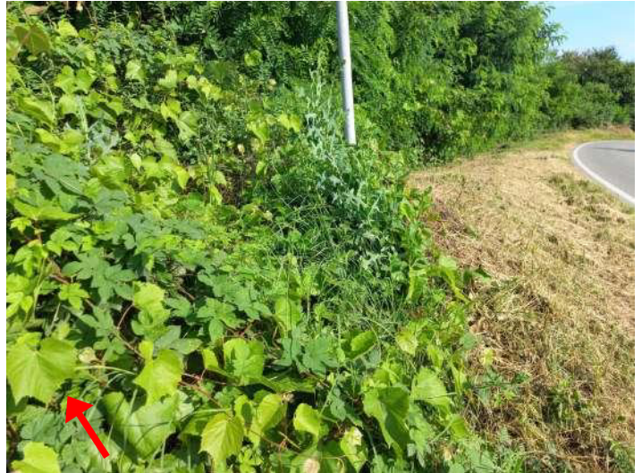
PORTAMENTO DELLA VITE E DETTAGLIO FOGLIA