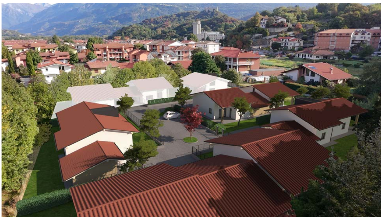
Foto 3: Vista da sud verso la cascina della proprietà a nord e la proprietà Freccero verso est